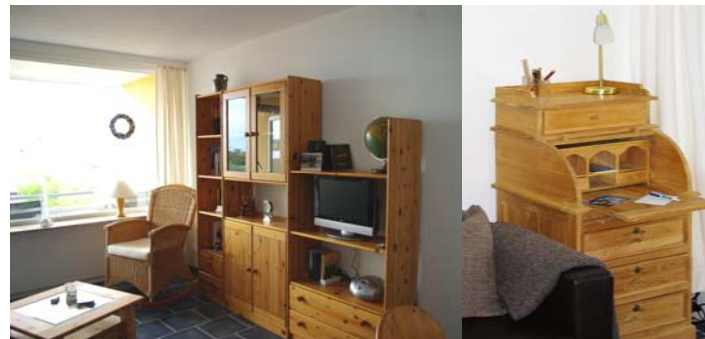
Sonniger und gemütlicher Wohn-/Schlafraum.

Bücher und Gesellschaftsspiele für evtl. Regentage, sowie Kabelfernseher mit DVD-Player und ein CD-Radio stehen Ihnen zur Verfügung.