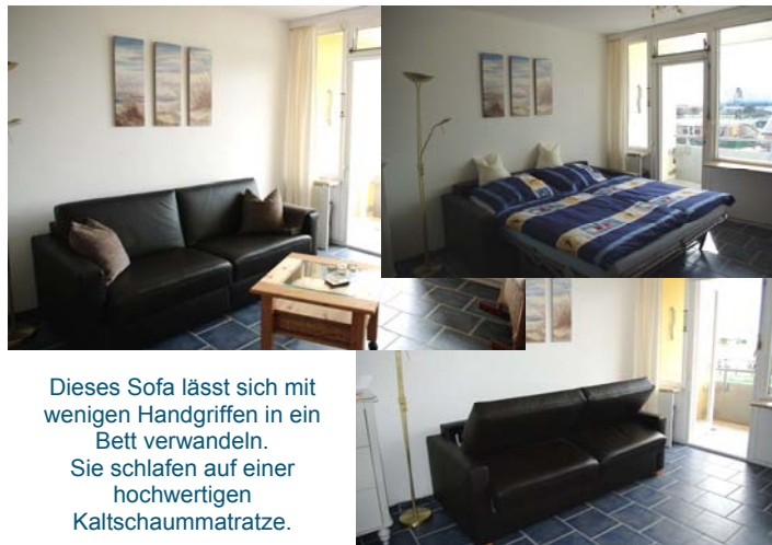
Dieses Sofa lässt sich mit wenigen Handgriffen in ein Bett verwandeln. Sie schlafen auf einer hochwertigen Kaltschaummatratze.

Bücher und Gesellschaftsspiele für evtl. Regentage, sowie Kabelfernseher mit DVD-Player und ein CD-Radio stehen Ihnen zur Verfügung.