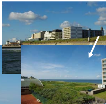
Blick vom Balkon seitlich auf das Meer und die Tennisplätze.

Von der Wohnung und dem Balkon haben Sie einen wunderschönen Blick seitlich auf das Meer.