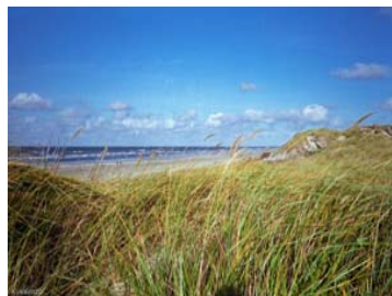
Nur wenige Schritte bis zum Strand und der Promenade.

Einkaufsmöglichkeiten, Restaurants und Bars finden Sie in unmittelbarer Nähe.