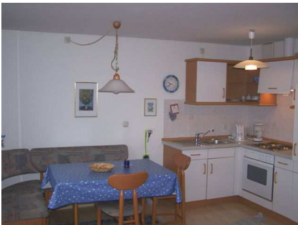
Wohnzimmer mit Küche