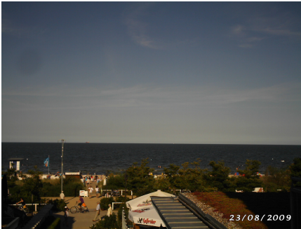
Bansin Blick zum Meer